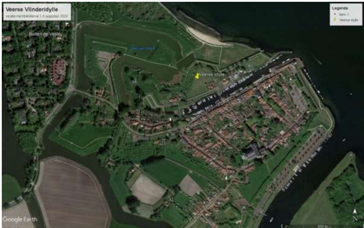
Situering van de locatie in van Veerse vlinderdijle aan het Bastion