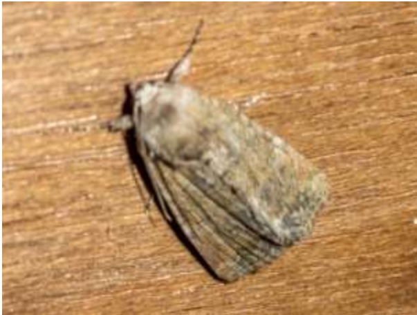
8 augustus 2020