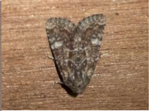
8 augustus 2020