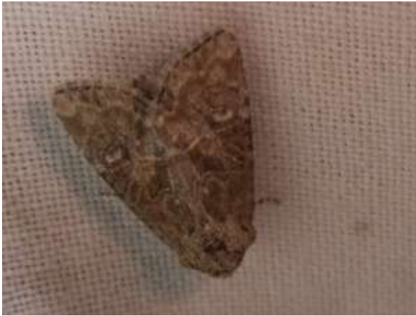
7 augustus 2020