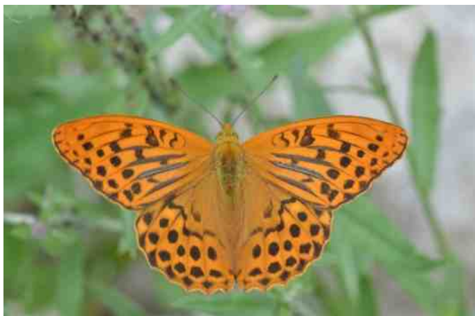
Man met duidelijke geurstrepen

Op de onderkant van de vleugels zijn vaak parelmoerachtige vlekken te zien, daaraan hebben de parelmoervlinders hun naam te danken. Onze enige Zeeuwse parelmoervlinder, de Kleine parelmoervlinder, is daar het beste voorbeeld van.