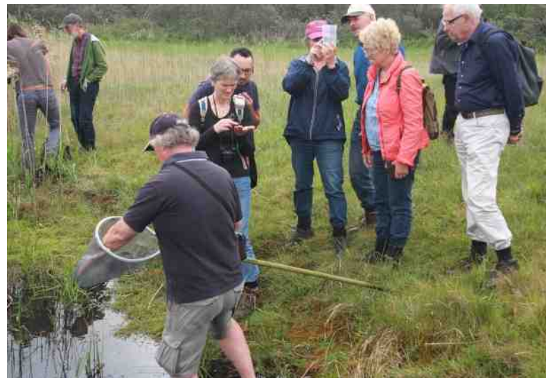
Op zoek naar libellenlarven

In het open veld tussen de plasjes en de bosrand kwamen we al de eerste vlinders tegen: Hooibeestje, Bruine daguil, Sint-jacobsvlinder en Gele kustspanner. Het laatste vlindertje liet zich lastig fotograferen omdat het zich doorgaans diep in de vegetatie liet vallen, of zelfs langs een stengel achterwaarts naar onderen