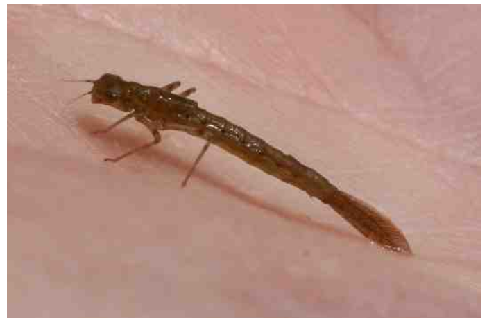
Larve van een juffer, Lantaarnkje