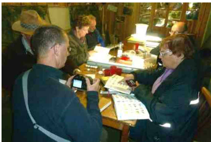
Determineren vanaf foto's

Na de invallende duisternis werd het pikdonker in het bos. Vier personen die te laat kwamen konden ons in