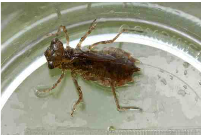
Larve van een echte libel, heidelibel