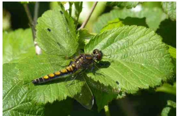
Gevlekte witsnuitlibel vrouw

de libellen afkomstig waren van een andere dichtbij gelegen locatie. Het bleef bij deze ene keer in mijn tuin, terwijl er bij de poelen op het Groot Vroon (afstand tot mijn tuin 800 m) 5 exemplaren (4 man en 1 vrouw) zijn gezien tussen 19 mei en 22 juni.