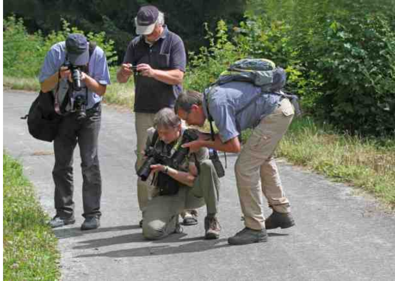
Enthousiaste Zeeuwen bij de eerste Grote weerschijnvlinder

Één van de soorten van ons project 'Op de bres voor de Zeeuwse zes' is de Grote vos. Van deze soort is een kleine populatie aanwezig bij Dishoek, maar deze populatie is te klein om levensvatbaar te zijn, als tenminste niet af en toe zwervers uit oostelijker streken een genetische bijdrage leveren. De herkomst van deze zwervers is onbekend, maar de dichtstbijzijnde grotere populaties bevinden zich in de Ardennen. Om een beter inzicht te krijgen in de specifieke habitateisen van de Grote vos, leek het ons nuttig om een studiereis te organiseren naar de Viroinval. Deze studiereis is mede mogelijk gemaakt doordat de stichting Groen en Doen aan ons project een subsidie