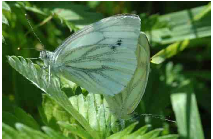
Klein geaderd witjes 1e generatie, zware bestuiving