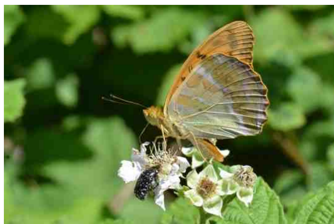
Onderkant achtervleugel met zijn karakteristieke tekening

De onderkant van de achtervleugel heeft in tegenstelling tot de ondervleugels van de meeste parelmoervlinders geen parelmoervlekken, maar lange zilverwitte strepen op een groenachtige ondergrond. Ook hier is de Keizersmantel goed aan te herkennen. Alleen de Kardinaalsmantel en de Tsarenmantel hebben deze strepen ook maar de laatste komt voor in het uiterste oosten van Europa en is in West-Europa nog niet gezien. De Kardinaalsmantel komt weliswaar