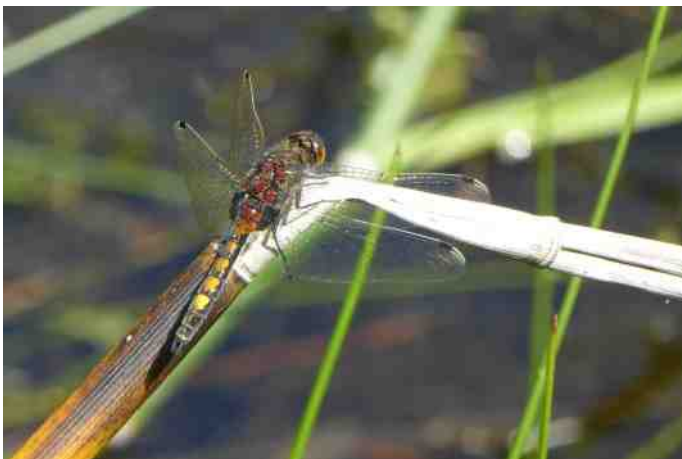
Gevlekte witsnuitlibel man