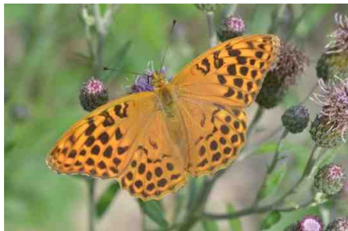
Vrouw zonder geurstrepen

Ondanks dat de circa 45 soorten parelmoervlinders die in Europa vliegen vaak grote determinatie-problemen op leveren, omdat ze veel op elkaar lijken, is de Keizersmantel goed te herkennen, zelfs van een afstand.