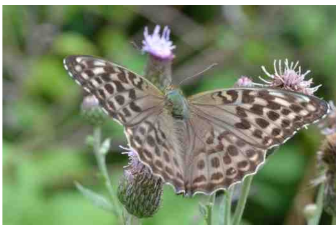
Vrouw in de bruine form valezina

Zoals hiervoor beschreven zijn de mannetjes eenvoud-