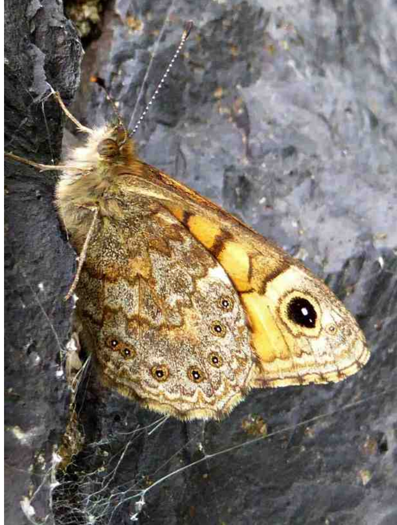
Argusvlinder, warmt zich op tegen een basaltmuur

Corrie en ik zouden de noorddijk van dit deel van Zuid-Beveland doen. Maar bij het wegrijden uit Krabbendijke nam ik heel eigenwijs de verkeerde afslag en belandde we bij Roelshoek direct aan de